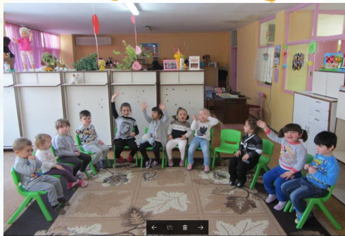
ДГ „Еделвайс“ с. Жиленци